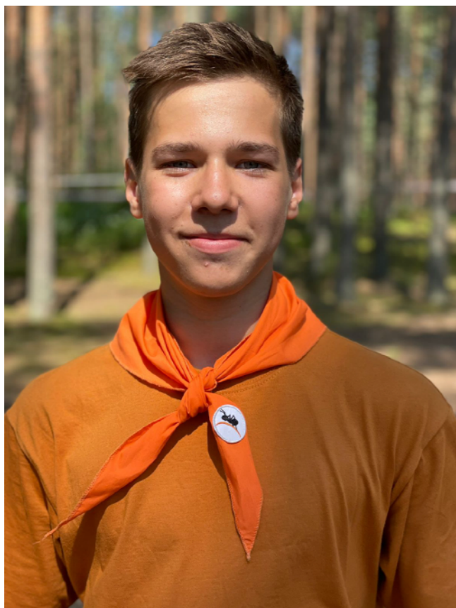
Отряд «Роверы» (возраст 12-16 лет)

Для подростков 12-16 лет особенно важно находиться среди «своих» людей и чувствовать свободу выбора. Нет сильнее в этом возрасте стимула, чем компания сверстников-единомышленников, которые ежедневно бросают себе вызов и добиваются результатов, поддерживая друг друга.