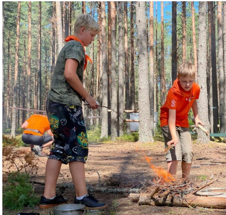
Отряд «Юниты» (возраст 7-11 лет)

Для подростков 12-16 лет особенно важно находиться среди «своих» людей и чувствовать свободу выбора. Нет сильнее в этом возрасте стимула, чем компания сверстников-единомышленников, которые ежедневно бросают себе вызов и добиваются результатов, поддерживая друг друга.