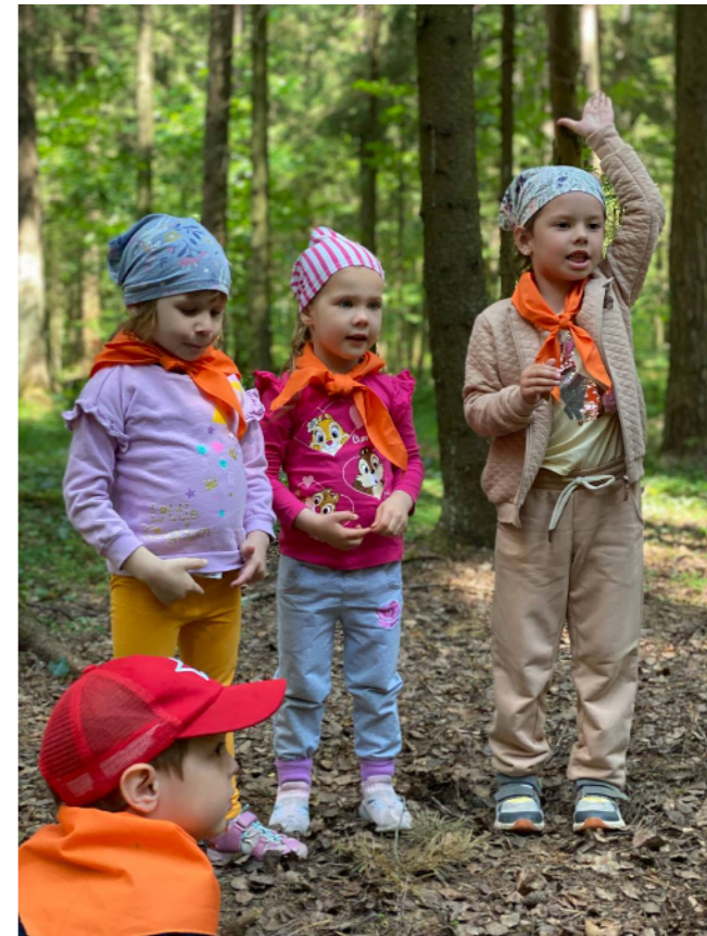
Отряд «Кабюниты» (возраст 4-6 лет)

Для детей 7-11 лет часто это первое путешествие без родителей. Наша задача — создать для маленьких участников условия, в которых они смогут проявить самостоятельность, чувствуя поддержку от ведущих, сверстников и от ребят постарше.